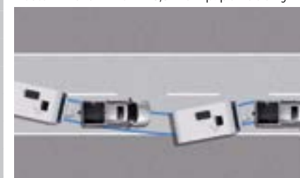
TSC - System kontroli kołysania przyczepy