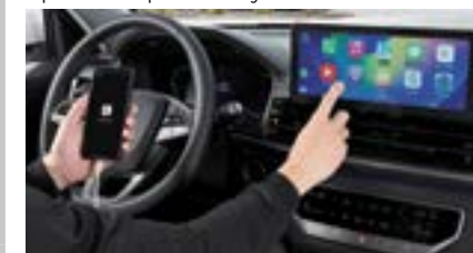
Android Auto / Apple CarPlay